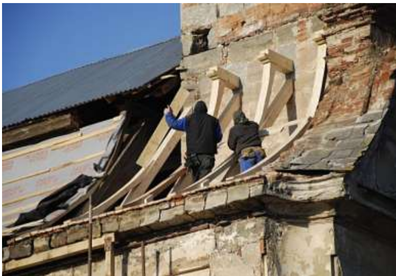
Kostel sv. Jana Křtitele v Brenně, oprava střechy.