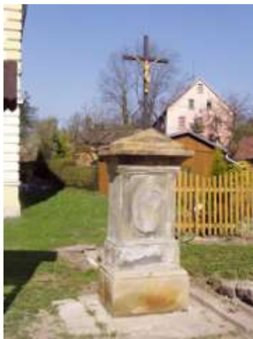
Kříž u obecního úřadu v Novém Oldřichově