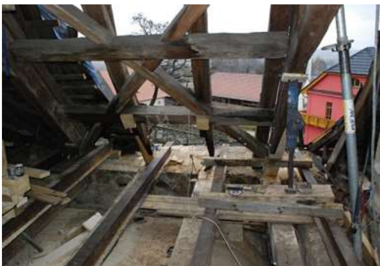
Kostel sv. Jana Křtitele v Brenné, oprava střechy.