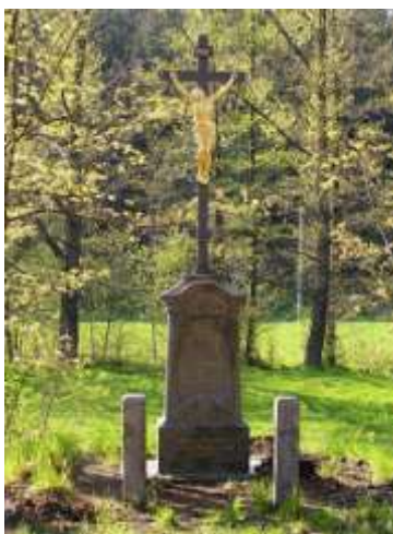
Kříž u silnice z Mníšku u Liberce do Oldřichova v Hájích