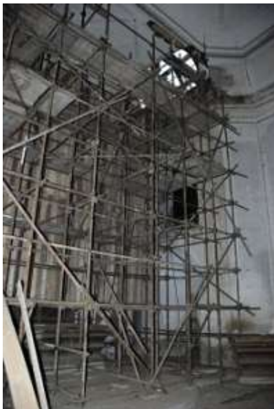
Kostel sv. Jana Křtitele v Brenné, vnitřní lešení.