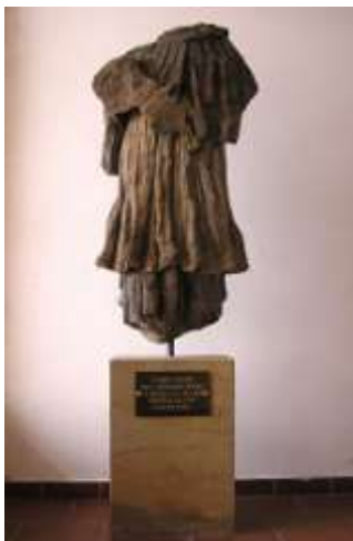
Torzo sochy sv. Jana Nepomuckého v České Lípě