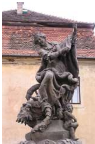
Socha sv. Kateřiny v Mítoni