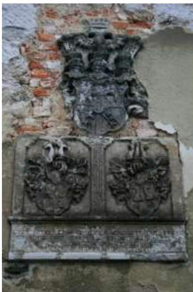
Erby na fasádě zámku, současný stav

Vzhledem ke stavu zámku je nasnadě myšlenka, aby byly erby sneseny a přemístěny například do místního kostela nebo ústeckého muzea a následně zakonzervovány, což by vedlo k jejich záchraně.