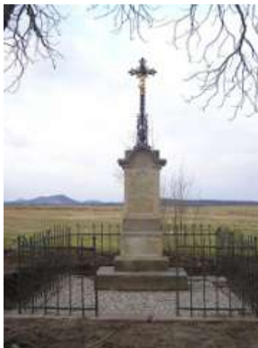
Kříž na východním okraji Vlčího Dolu

Na dvoustupňovém fundamentu stojí dvoustupňový podstavec, dolní širší stupeň má na přední straně mělký výklenek. Sokl má na přední straně také mělký výklenek, ve kterém byl dříve rytý nápis. Hlavice má do stran