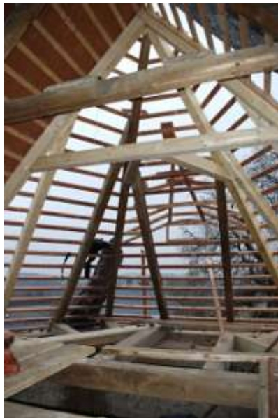
Kostel sv. Jakuba Většího v Bořejově, oprava střechy.