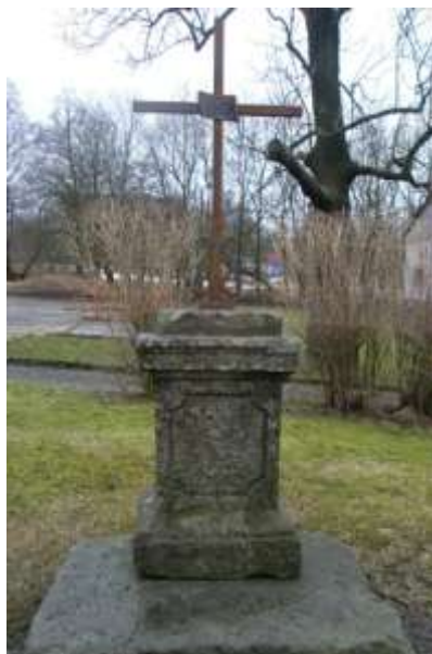
Kříž (původně socha sv. Jana Nepomuckého), současný stav