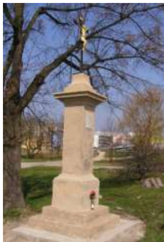
Kříž u sídliště Sever v České Lípě