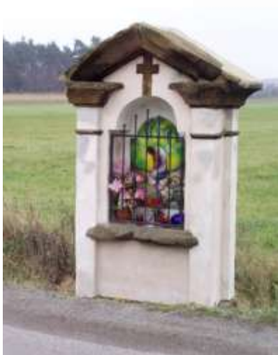
Jediná dochovaná kaplička u poutní cesty z Mimoně do Svěbořic.

V barokní době se ve zdejší krajině usadilo také několik poustevníků. S jejich skromnými příbytky bychom se tenkrát setkali v eremitážích Wildthal (Zbysko), při kapli sv. Jana Křtitele u Kuřívod, v Borečku (zde se dodnes dochovala kaplička sv. Jiljí, Eustacha a Huberta) a také na troskách středověkého hrádka Stohánku.