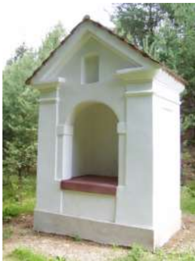
Kaplička Čtrnácti Pomocníků u Stráže pod Ralskem.

V obcích, které neměly svůj vlastní kostel, ale i porůznu v krajině, zbudovali naši předkové řadu kaplí. Z nich zaslouží připomenutí kaple Nanebevstoupení Páně z roku 1671 u bývalého Hvězdova, rozšířená roku 1777 v kostelík, kaple Nejsvětější Trojice v někdejší vsi Okna (z r. 1764) či pozoruhodná dřevěná šestiboká kaple sv. Floriána v Olšině. Z drobnějších památek jmenujme alespoň kapličku Čtrnácti Pomocníků u cesty ze Stráže do Svěbořic (opravenou r. 2005 zásluhou občanského sdružení Drobné památky severních Čech) a kapli sv. Augustina ve Vrchbělé z roku 1815, jejíž zasvěcení připomínalo působení bělského augustiniánského kláštera. V obci Židlov zasvětili místní obyvatelé svou kapličku svatým mučedníkům Janu