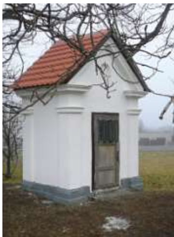
Kaplička na východním okraji Kamenického Šenova