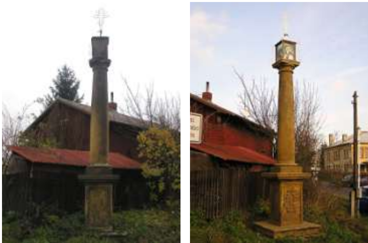
Boží muka u odbočky z Jablonného v Podještědí do Petrovic