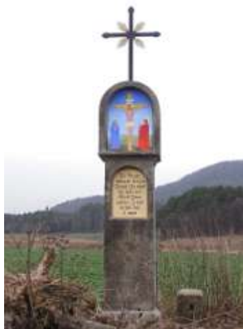
Boží muka pod Šedinou u Skalky u Doks