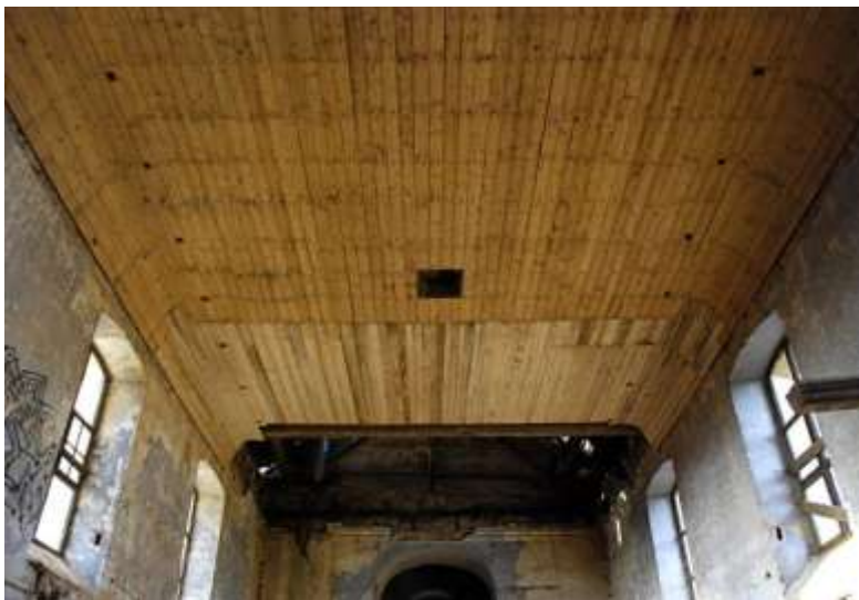
Kostel sv. Mikuláše v Drchlavě, prkenné podbití stropu.