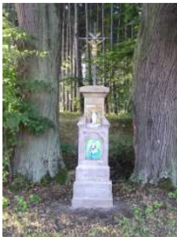
Kříž u silnice z Luk do Oken