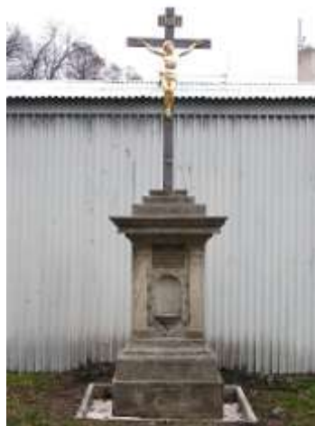
Kříž v ulici Újezd v České Lípě