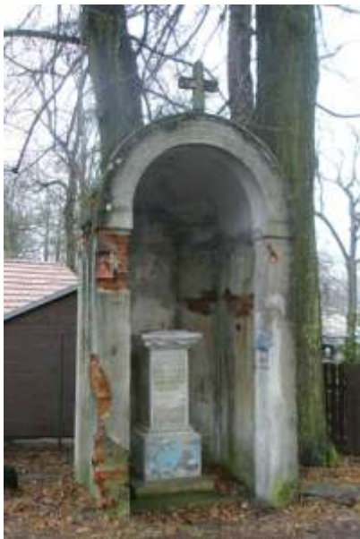
Kaple Panny Marie, současný stav