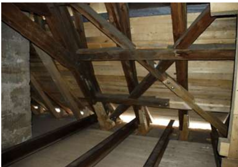
Kostel sv. Jana Křtitele v Brenně, oprava střechy.