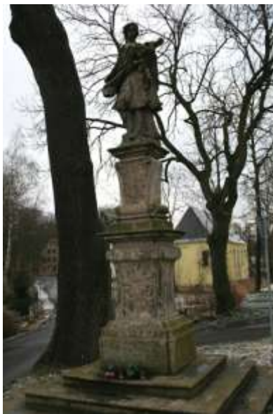
Socha sv. Jana Nepomuckého, současný stav

Jan z Nepomuku, mocný Patron v Čechách, kěz chrání Krásný Les, který se k němu sklání, aby byl prost hanby a urážek. Jeho přimluva je velká a mocná pro ty, kdo ho ctí a tomu, kdo jej zbožně pozdraví je nebeské koruny rozmnožitelem.