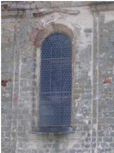
Kostel Nanebevzetí Panny Marie v Konojedech, obnovená okna.