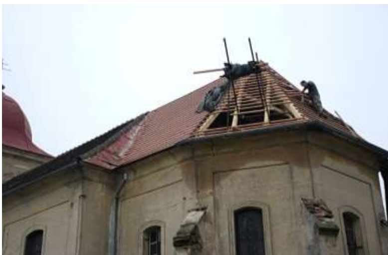
Kostel sv. Jakuba Většího v Bořejově, oprava střechy.

biskupství. V roce 2009 by měla pokračovat oprava stropu a střechy lodi, která by při dostatečné výši finančních prostředků mohla být dokončena.