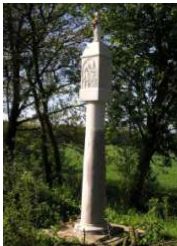
Boží muka na jihovýchodním okraji Častolovic