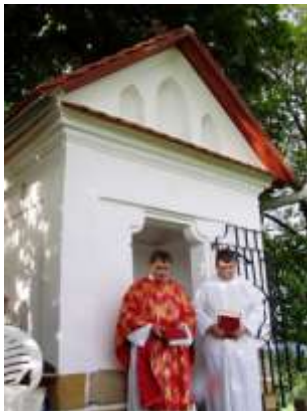
Svěcení Schröterovy kaple