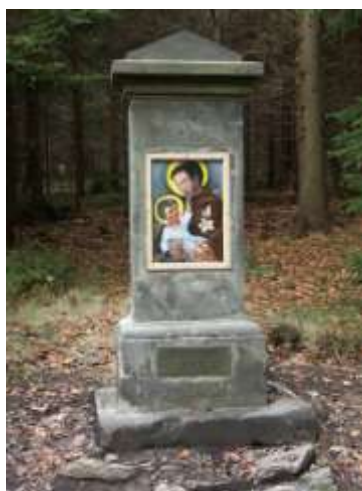
Obrázek sv. Antonína u Svoru