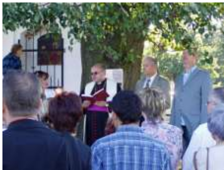
Knäspelova kaple u Polevska