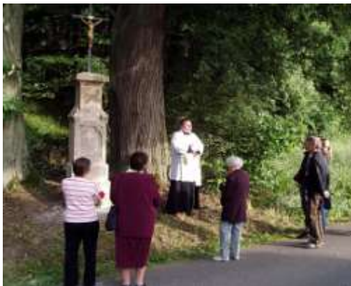
Požehnání kříže u Luk