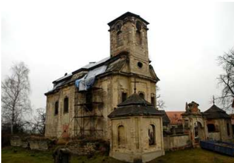
Kostel sv. Jana Křtitele v Brenné, celkový pohled.