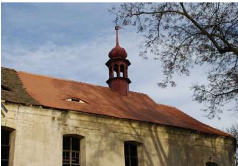
Kostel sv. Mikuláše v Drchlavě, obnovená část střechy.