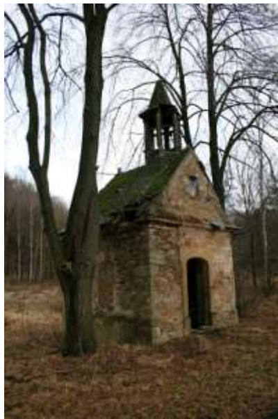
Kaple sv. Petra a Pavla, současný stav, foto L. Šimko