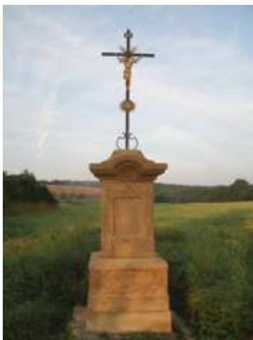
Kříž u Tuháně u odbočky do Mošnice

Na betonovém fundamenteu stojí podstavec, který má na všech bočních stěnách uprostřed vystouplá pole s vykrojenými rohy a nahoře je ukončen do stran vysazenou římsou. Sokl má na přední straně výklenek po osazené desce, kolem něhož je vystouplý reliéf festonu, a na bocích jsou niky. Hlavice má do