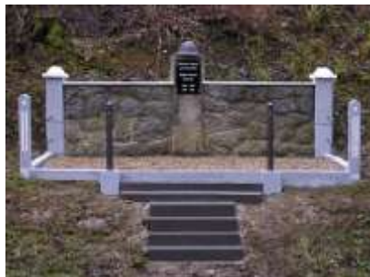
Pomník padlým v Častolovicích