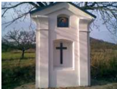
Kaplička ve starých sadech u Svojkova