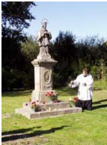
Požehnání obnovené sochy 13. září 2008