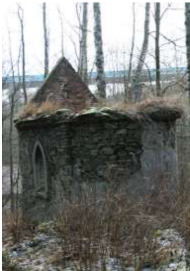
Kaple u celnice, současný stav