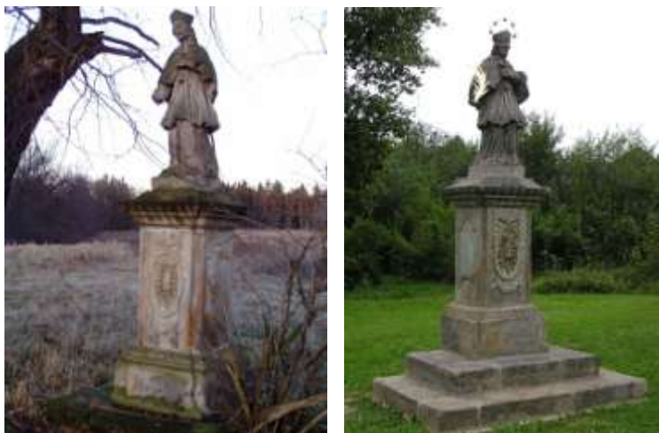
Socha sv. Jana Nepomuckého v Dubnici

Socha původně stála mezi dvěma lipami na návrší v louce, asi 300 m východně od Dubnice, na úrovni kostela. Nevedla k ní již žádná cesta a začaly ji ohrožovat padající větve ze starých okolostojících lip. Společně s obecním úřadem bylo dohodnuto, že socha bude zrestaurována a přenesena na vhodné místo v obci. Nové stanoviště bylo vybráno v malém parčíku u hlavní komunikace, procházející Dubnicí.