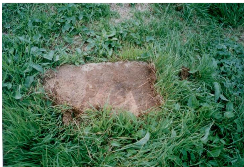
Základna nebo vrchní polovina dříku? (M. Urban)