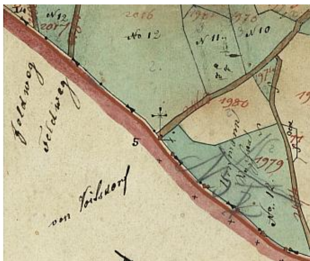
Výřez ze stabilního katastru, r. 1845 (1. Voitsdorf, 2. Ebersdorf)