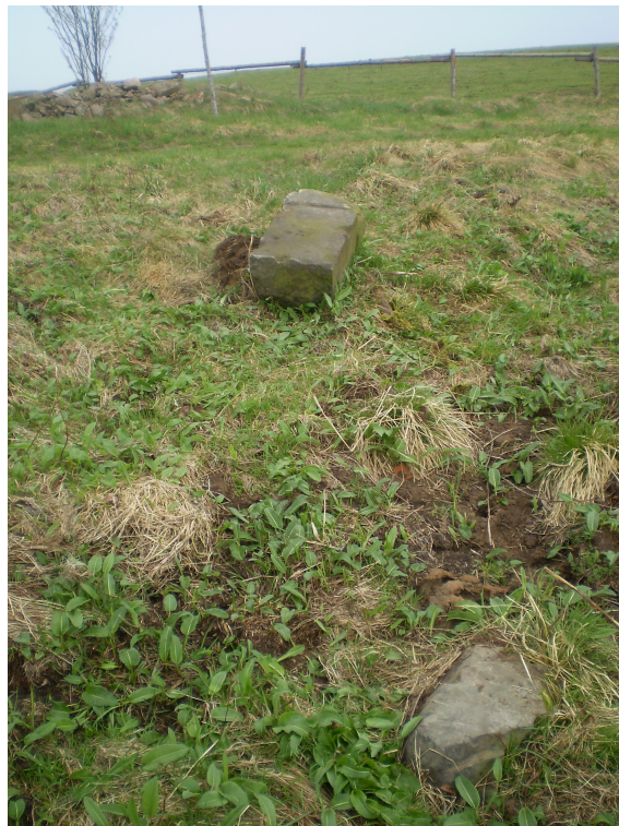
Další fragment kříže? (O. Kotouč, 2006)