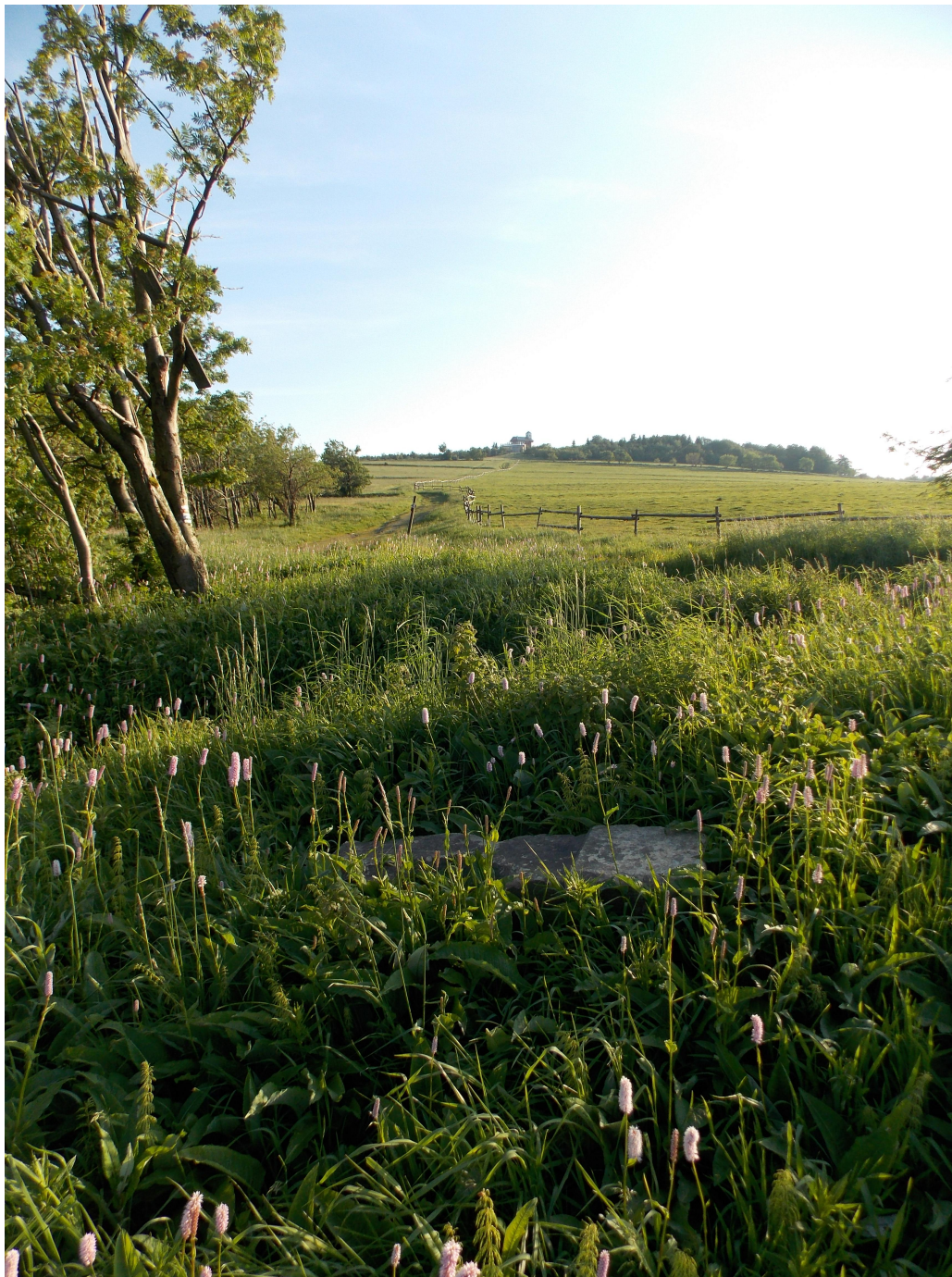
Goldammerkreuz – léto 2014 – pohled na Komáři vížku (Mückentürmchen) (O. Kotouč)

Pokud se nepodaří kříž zrekonstruovat, či bude-li přistoupeno k jeho úplnému znovuvytvoření, je naplánován převoz torza této drobné, leč nikoliv nezajímavé, památky do lapidária duchcovského městského muzea (máme v tomto směru předběžný souhlas PhDr. J. Wolfa ).