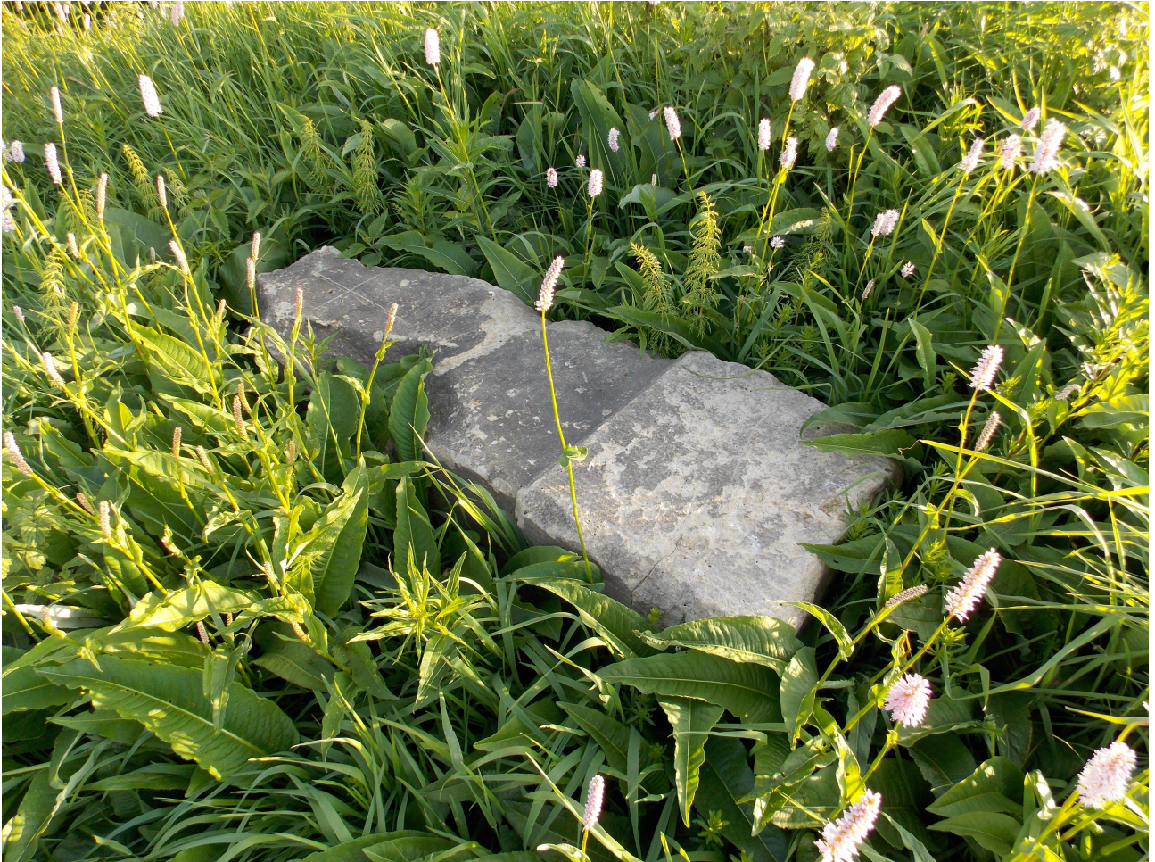
Torzo dříku – léto 2014