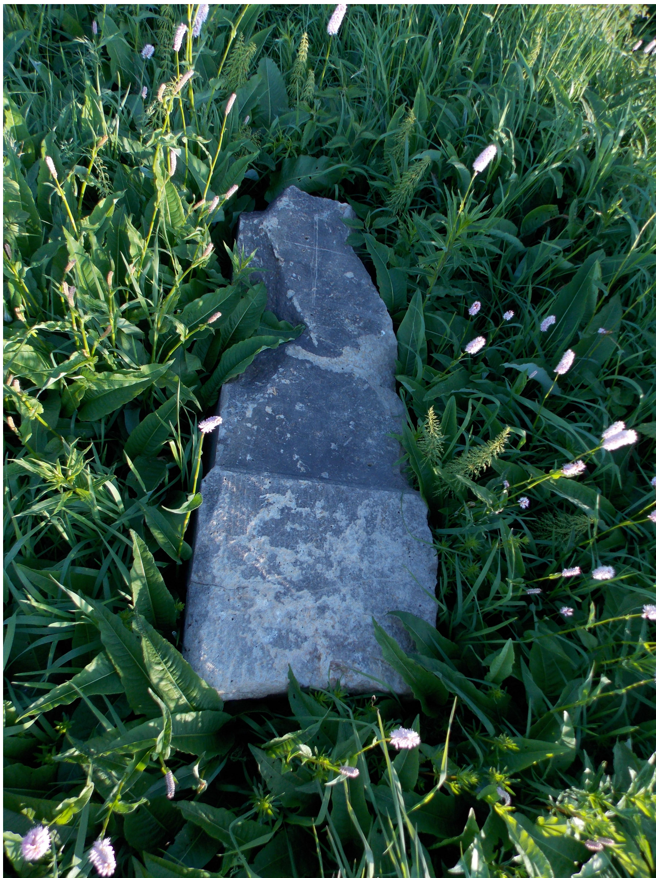
Torzo dříku – léto 2014 (O. Kotouč)