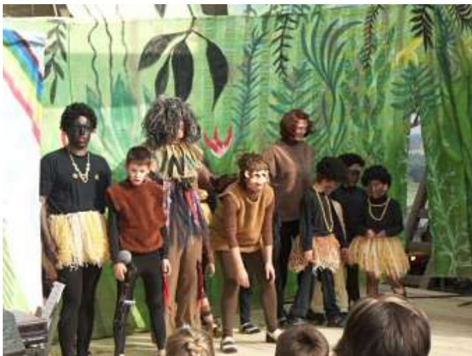
Divadelně-hudební festival na Ostrém 10. září 2005 - představení pro děti "Kouzelná maska" v podání Divadla J. M. a J. B.