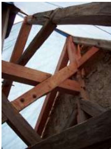
Drchlava, stav po opravě střechy v roce 2005. Pohled na opravený radiální prahový rošt stolice věžičky (vlevo) a opravené prvky podélné vazby krovu (vpravo).