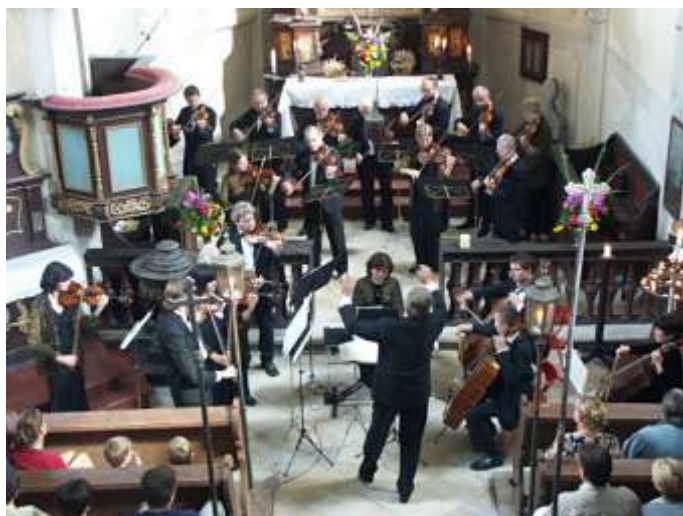
Koncert Symfonického orchestru Dvořákova kraje 4. září 2005.