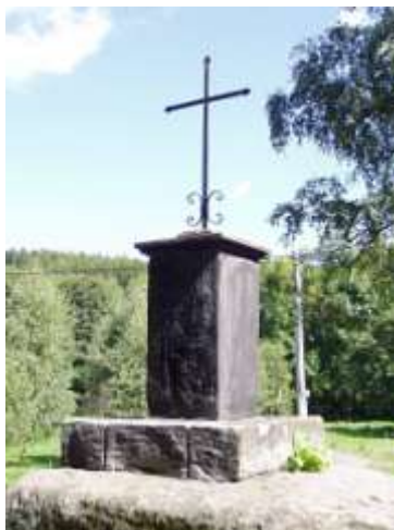
Kříž u silničky z Juliovky do Hamru