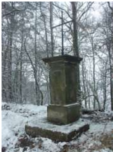
Kříž u silnice z Písečné do Dobranova