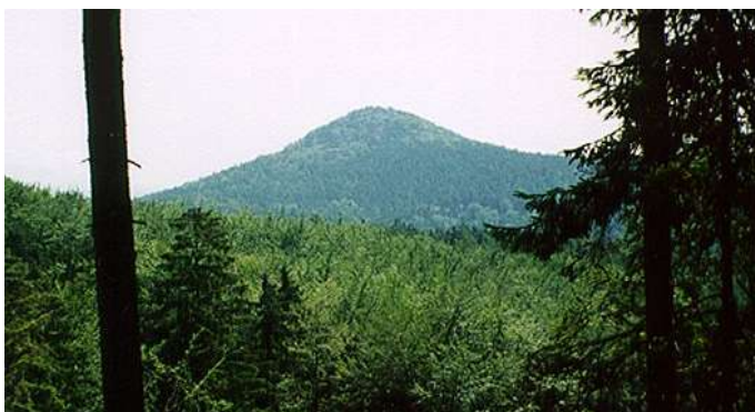
Pohled na Jezevčí vrch

Hustě zalesněný kopec u Heřmanic se nazývá Jezevčí vrch (Limberg). Je mnohem vyšší než Sokol (Falkenberg) a leží směrem na západ od něj. Na úpatí Jezevčího vrchu se rozkládají krásné smrkové a jedlové lesy, zatímco strmý východní sráz a vrchol kopce pokrývá svěží zelené listoví buků. Tu a tam se mezi lesním porostem objeví loučka a též malá údolíčka, podobná spíše jakýmsi průřvám, kudy si našla cestu voda lesních potůčků. Tato místa skýtají poutníkovi, vystupujícímu vzhůru, místo k odpočinku a tichému naslouchání. Na vrcholu nenajdeme žádnou zříceninu a ani žádná zpráva nesvědčí o tom, že by tu kdy měl nějaký hrad stát. Zatímco jsou tedy pověsti o vrchu Sokolu a na něm stojícím Starém Falkenburku alespoň v jádru zakotveny v jakési historické skutečnosti, patří všechny pověsti o Jezevčím vrchu s výjimkou jedné jediné, jen do pomyslného světa kouzel a pohádek. Před naším vnitřním zrakem se tak vynořují postavičky gnómů, skřítků a trpaslíků, kterými zdejší tajuplně temné lesy ožívají.