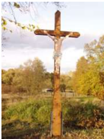
Kříž u silnice z Heřmaniček k Brennskému mlýnu