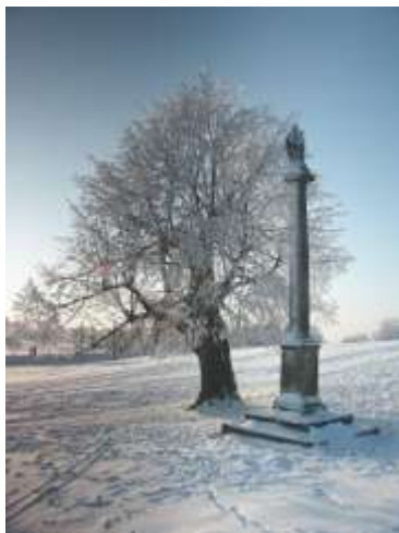
Mariánský sloup u Práchně v zimě 2005