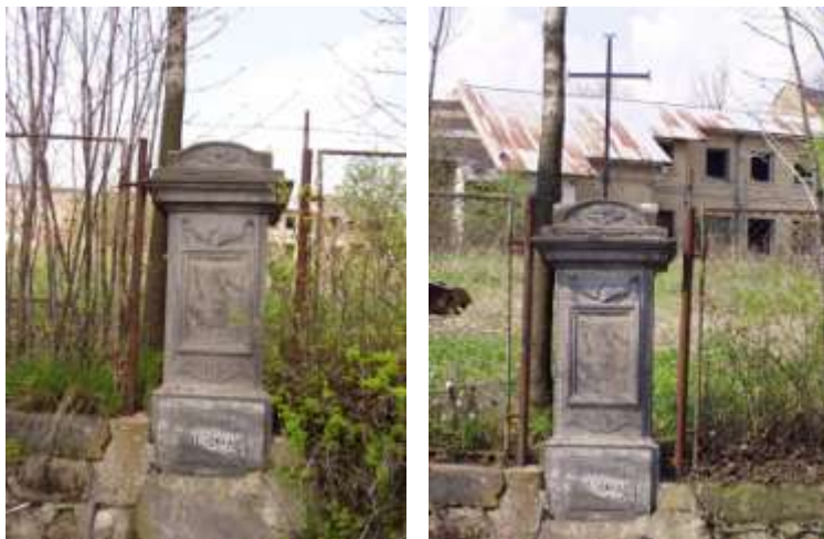
Kříž u staré sklárny v Práchni