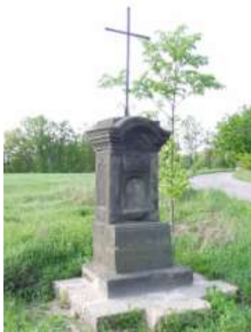
Kříž u silnice z Dobranova do Vlčího Dolu