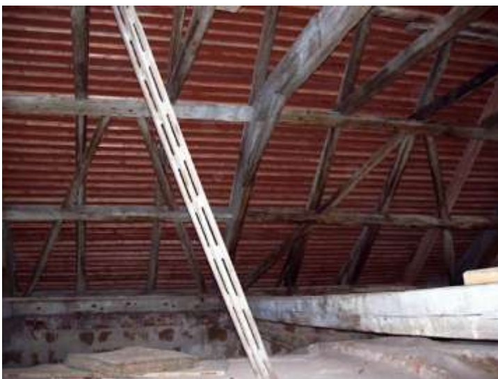
Pavlovice, kostel Nanebevzetí Panny Marie. Celkový pohled z půdy na severní část střechy po opravě v roce 2005.