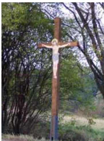
Dřevěný kříž u silnice z České Lípy do Horní Libchavy