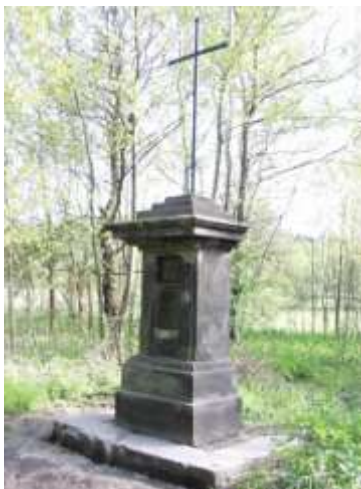
Kříž v České Lípě u Ploučnice