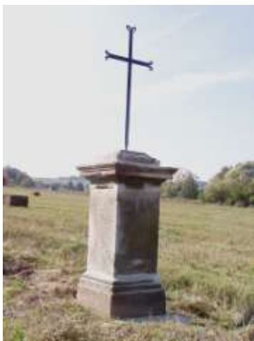
Kříž v poli mezi Jestřebím a Újezdem