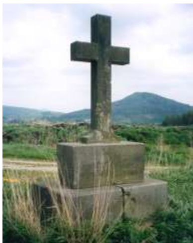
Grohmannův kříž u Cvikova