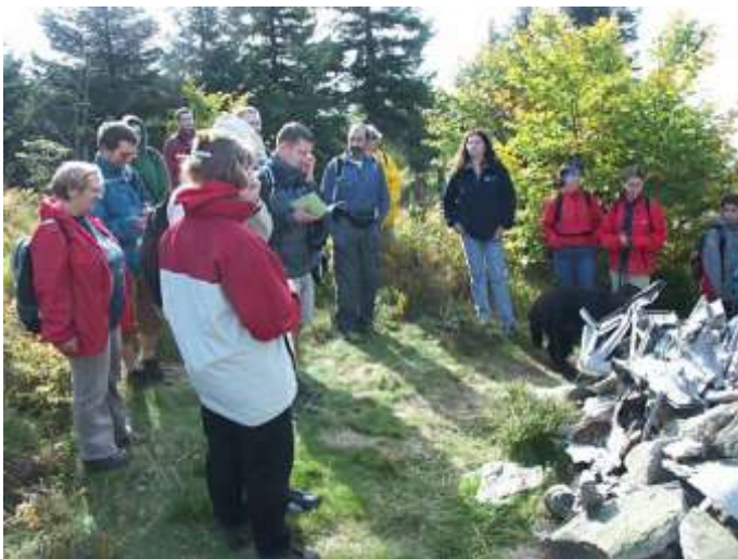
Zastávka u mohyly letců.