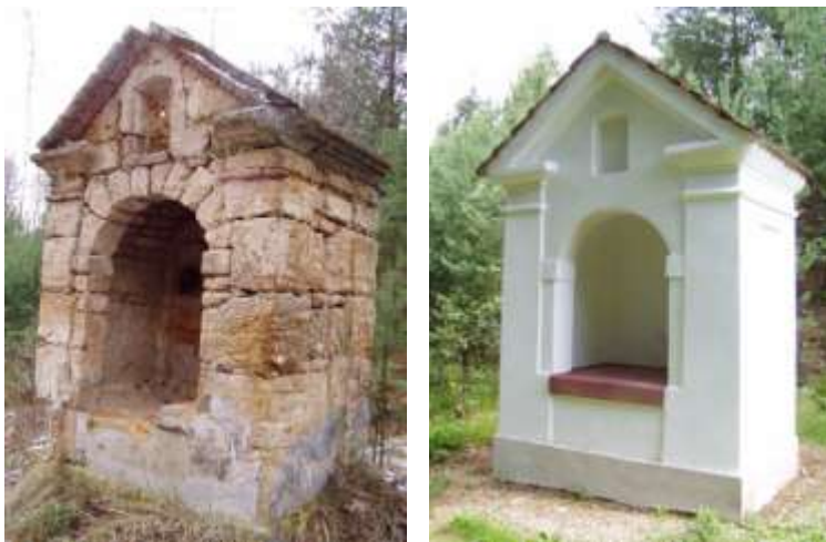
Kaplička 14 sv. pomocníků u Stráže pod Ralskem

Materiál na obnovu věnoval majitel kapličky s.p. DIAMO Stráž p. R., finanční prostředky ve výši 20 000 Kč věnovalo naše občanské sdružení a opravu provedl člen sdružení ing. Vojtěch Král s pomocníky.