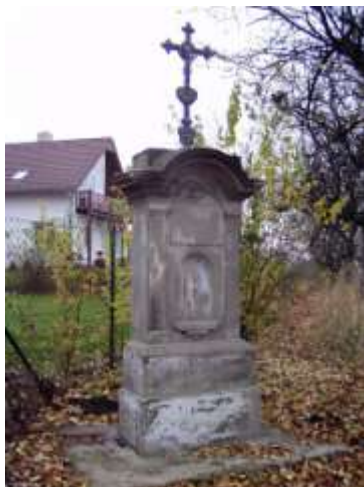
Kříž v osadě Plesa u Svojkova