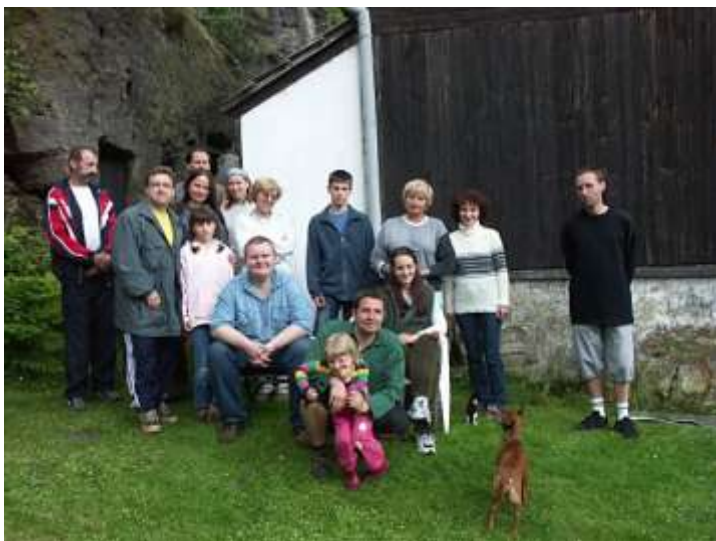
U Komersů v Nové Skalce.