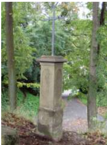
Kříž před hřbitovem v Kruhu