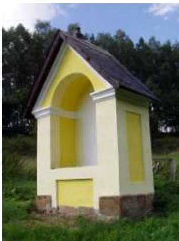
Kaple Panny Marie Sněžné v Dubnici