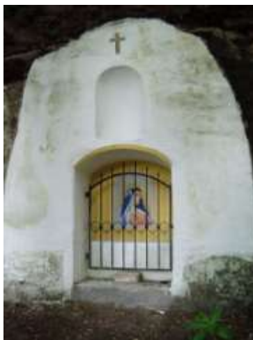
Skalní výklenek u silnice ze Zákup do Kamenice