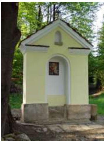
Kaplička Nejsvětější Trojice u cesty z Písečné do Šidlova