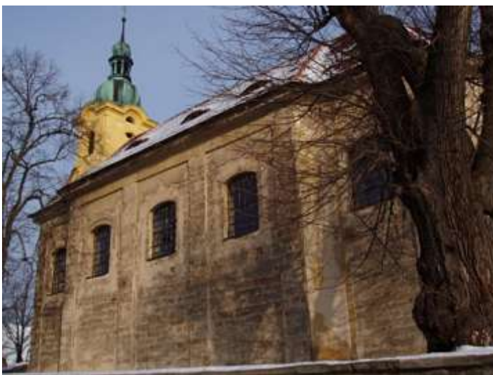
Kvítkov, kostel sv. Jakuba Většího. Celkový pohled od jihovýchodu na zchátralou jižní fasádu lodi kostela.