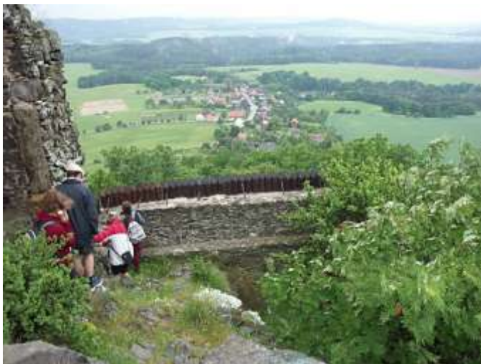
Výhledu ze Starého Berštejna počasí příliš nepřálo.