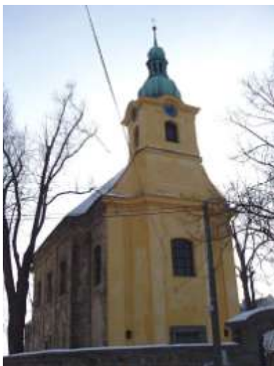
Celkový pohled po opravě západního průčelí v roce 2005.

V roce 2005 byl kompletně opraven omítkový plášť věže a celého západního průčelí. Byly sejmuty zdegradované omítky a nahozeny nové jednovrstvé vápenné, v členění podle konzultace s ing. P. Mackem. Po dohodě s ním byla určena i barevnost průčelí v základních plochách světle okrových a tektonických prvcích okrově oranžových. Práce byly provedeny v dobré kvalitě v souladu s podmínkami orgánů památkové péče.