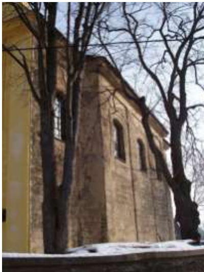
Kvítkov, kostel sv. Jakuba Většího. Vlevo je detailní pohled na opravené omítky věže a obnovený ciferník hodin, vpravo pohled na jižní fasádu lodi s téměř kompletně opadánými omítkami.