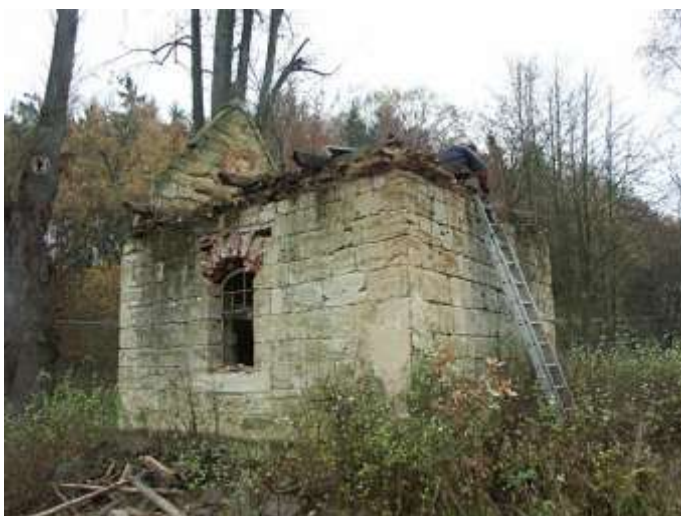
Kaple sv. Valentýna v Novém Šidlově před zahájením oprav (nahore) a po odstranění starého krovu 6.11.2005 (dole).