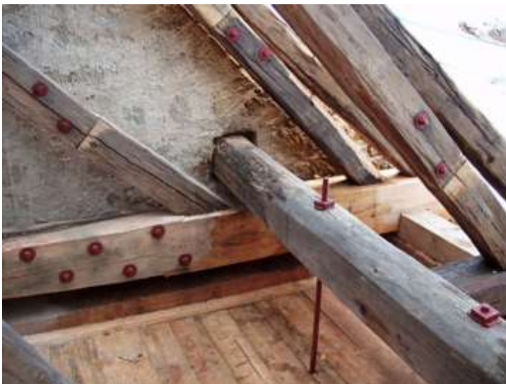
Drchlava, stav po opravě střechy v roce 2005. Pohled na opravená zhlaví vazného trámu a pat krokví, pohled od severozápadu.