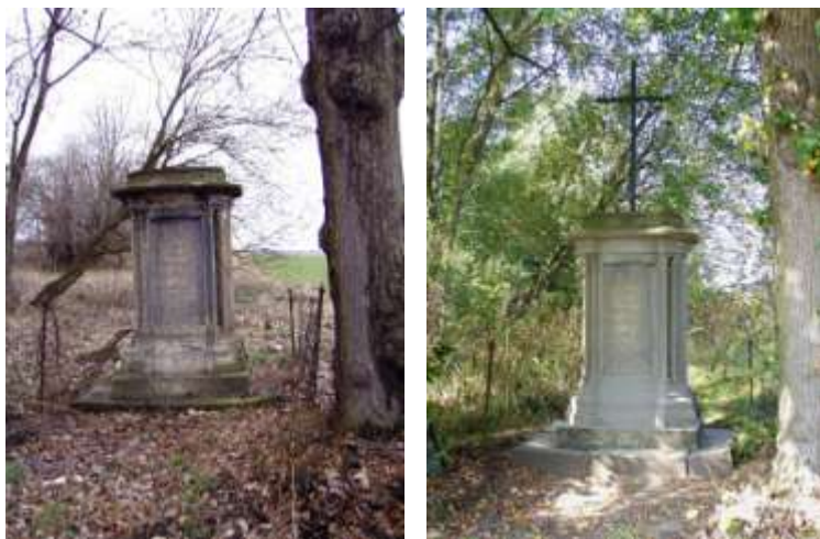
Kříž u silnice z Valteřic do Žandova