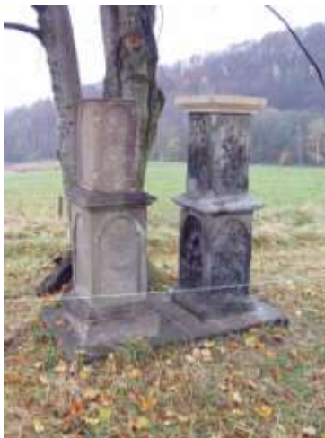
Kamenné sokly v Dolním Kamenickém Šenově