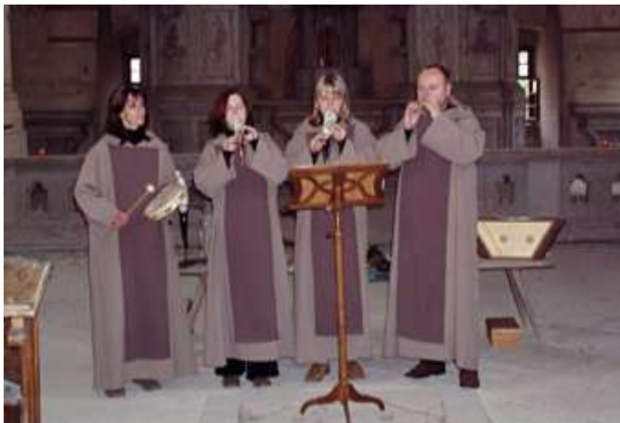
Vystoupení souboru SoliDeo v Konojedech 12. června 2005.

Pokračovali jsme v dalších akcích směřujících k oživení tohoto kostela o který se staráme v rámci písemné dohody s Litoměřickým biskupstvím. Dne 22.1.2005 proběhla brigáda, která dokončila vymýcení křovin v prostranství před kostelem, 12. června 2005 se uskutečnil koncert skupiny SoliDeo a dne 23.10.2005 proběhlo divadelní představení studentů Univerzity Karlovy z Prahy "Komédie o Heleně, dceři císaře tureckého".