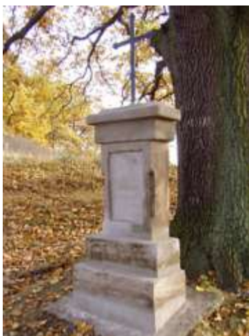
Kříž na Lískovém vršku u Žizníkova