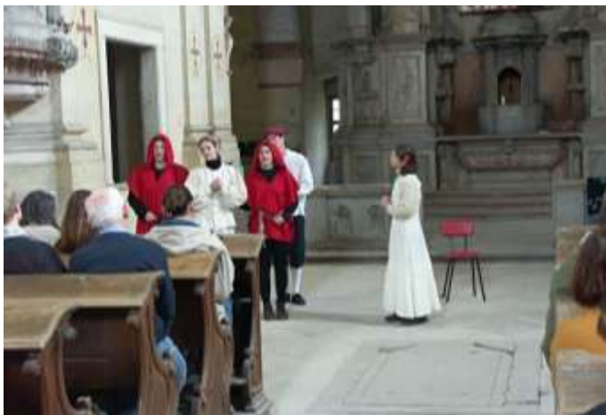
Komédie o Heleně, dceři císaře tureckého 23. října 2005.