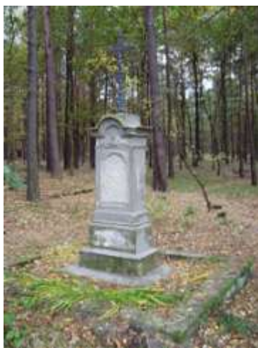
Kříž jižně od Žizníkova