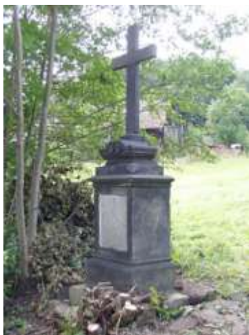
Kříž v horní části Lindavy