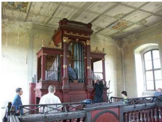
Oprava varhan 27. srpna 2005.