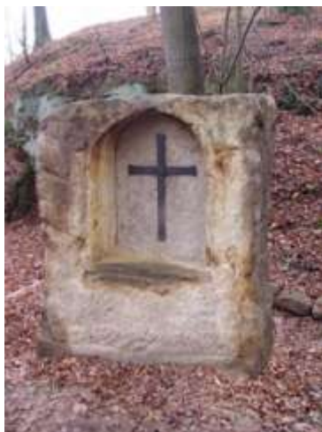
Skalní výklenek u cesty z Písečné do České Lípy