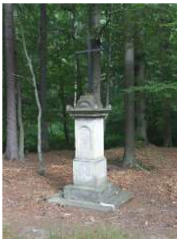
Kříž u Hamerského potoka poblíž Naděje