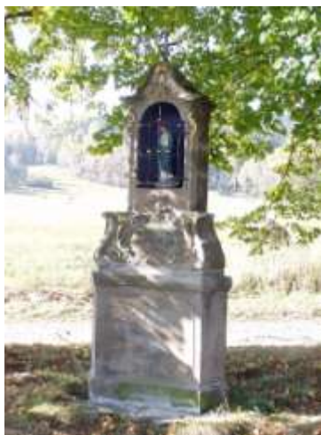
Modrá kaple u Petrovic