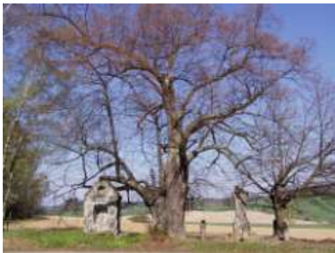
Kaplička s křížkem u Náhlova

Petrovice - Modrá kaple - Palmeho kříž Písečná - kaplička Nejsvětější Trojice u cesty do Šidlova - kříž u silnice do Dobranova - skalní výklenek u cesty do České Lípy Prácheň - kříž u staré sklárny Stráž pod Ralskem - kaplička 14 sv. pomocníků Stvolínecké Petrovice - kříž u silnice z Tanečku - kříž na návsi v Tanečku Svitava - Wernerův kříž u Záhořína Svojkov - kříž v osadě Plesa Trávník - Mariánský sloup Tuhaň - kaplička v poli za obcí Valteřice - kříž na mostku přes potok - kříž u silnice do Žandova Vlčí Důl - kříž na návrší Křížek Vrchovany - kříž pod kaštany Zahrádky - kaplička v Karasech Zákupy - skalní výklenek u silnice do Kamenice Žizníkov - kaplička pod Žizníkovským vrchem - kříž na Lískovém vršku - kříž jižně od osady Ždírec - Malchersův kříž