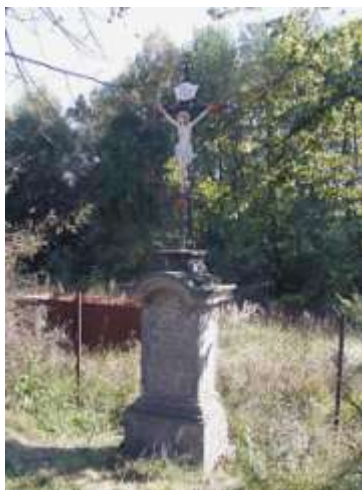
Kříž na východním okraji Cvikova