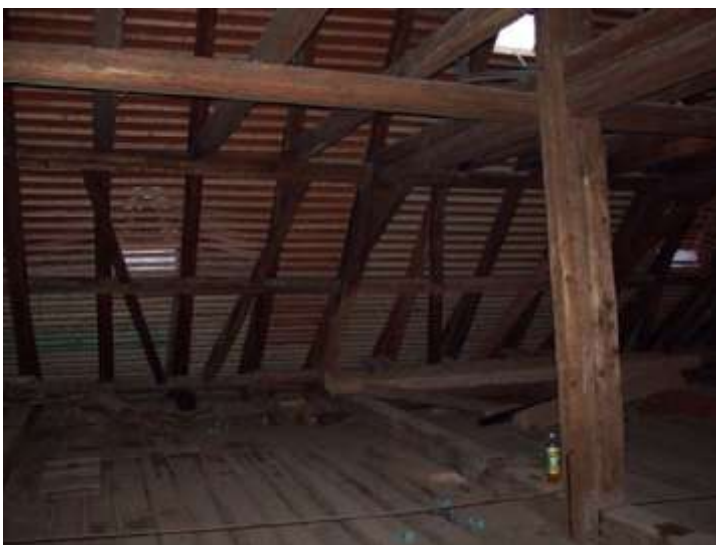
Stvolínky, kostel Všech Svatých. Celkový pohled v krovu na jižní část střechy po opravě v roce 2005.