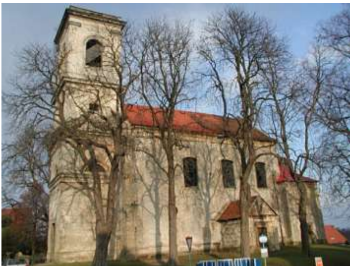
Pavlovice, kostel Nanebevzetí Panny Marie. Celkový pohled na kostel od jihu. Dobře je vidět ještě neopravená část střechy lodi.