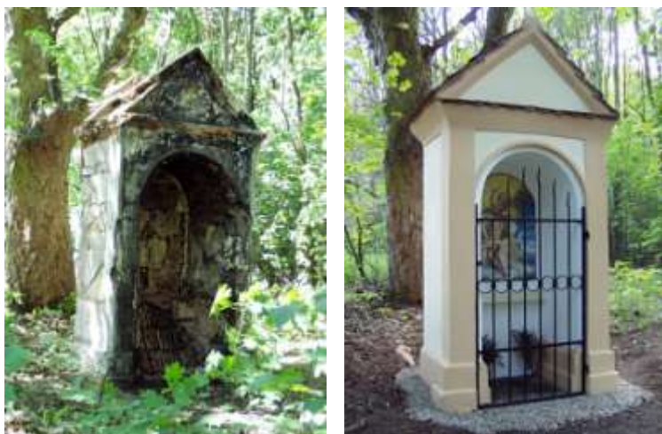
Kaplička pod Žizníkovským vrchem