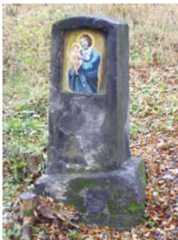
Obrázek sv. Antonína u silnice z Dolního Šenova do České Kamenice