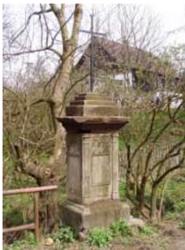
Kříž na mostku ve Valteřicích