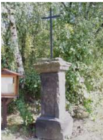
Kříž na návsi v Tanečku