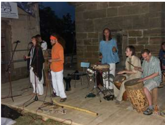
Divadelně-hudební festival na Ostrém 10. září 2005 - závěrečné vystoupení skupiny Létající koberec