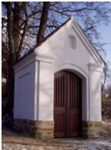
Kaplička v Karasech