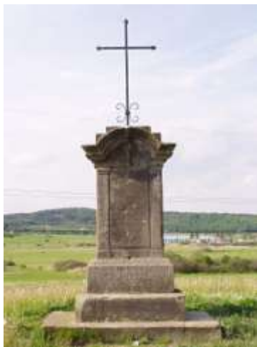
Kříž na návrší Křížek u Vlčího Dolu