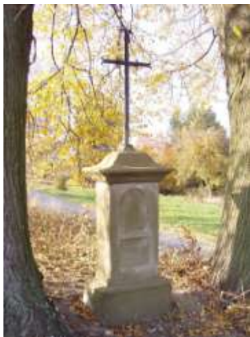
Kříž na jižním okraji Kruhu