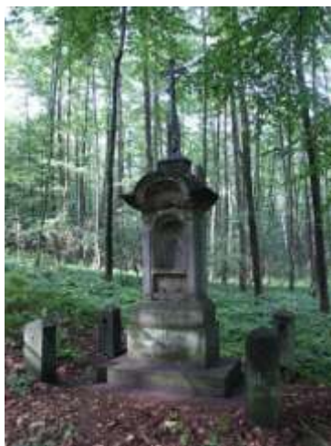
Wernerův kříž u Záhořina