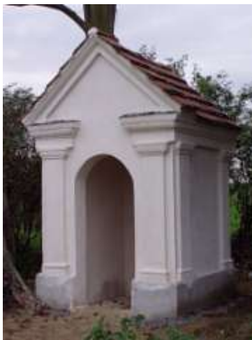
Kaplička v poli u Tuhaně