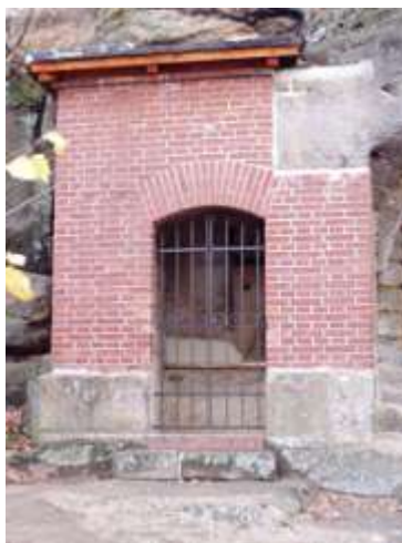
Kaplička na jižním konci Dobranova