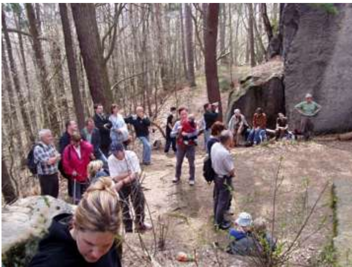
Osazení pamětní desky na Dutém kameni přihlíželo okolo 30 lidí.