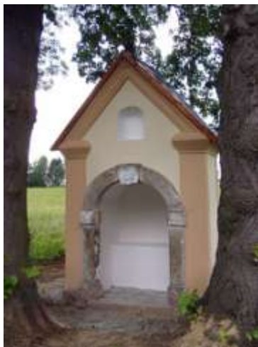
Niesigova kaple v Dubnici