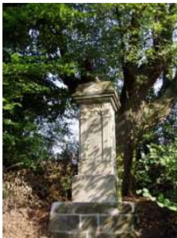
Kříž na východním okraji Častolovic