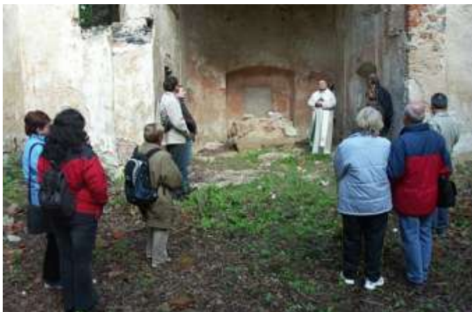
Pobožnost v kostele sv. Havla v Bílém Kostelci 8. května 2005.

Ve vyčištěných prostorách kostela sv. Havla proběhla 8.5.2005 pobožnost vedená knězem Janem N. Jiříštem z Bělé pod Bezdězem.