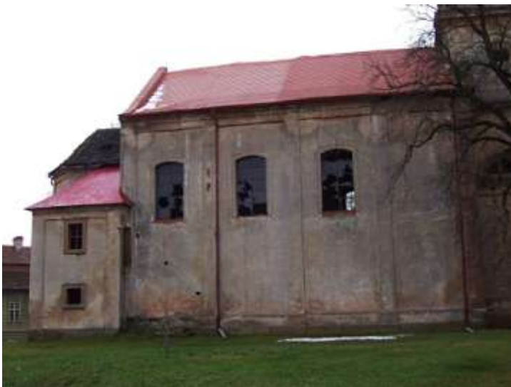
Pavlovice, kostel Nanebevzetí Panny Marie. Celkový pohled na loď kostela od severu po opravě střechy v roce 2005. Byla dokončena výměna střešní krytiny na této straně střechy a osazeny okapní žlaby a svody.