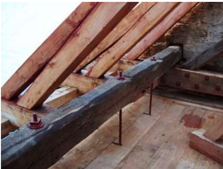
Drchlava, stav po opravě střechy a krovu v roce 2005. Pohled na opravená krátčata a obnovené zavěšení stropních trámů, pohled od jihozápadu.