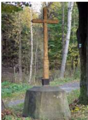
Dřevěný kříž v Martinově Údolí u Cvikova