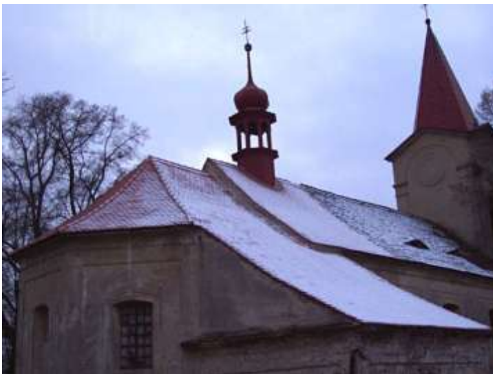
Drchlava, stav po opravě střechy a krovu v roce 2005. Celkový pohled od severovýchodu.