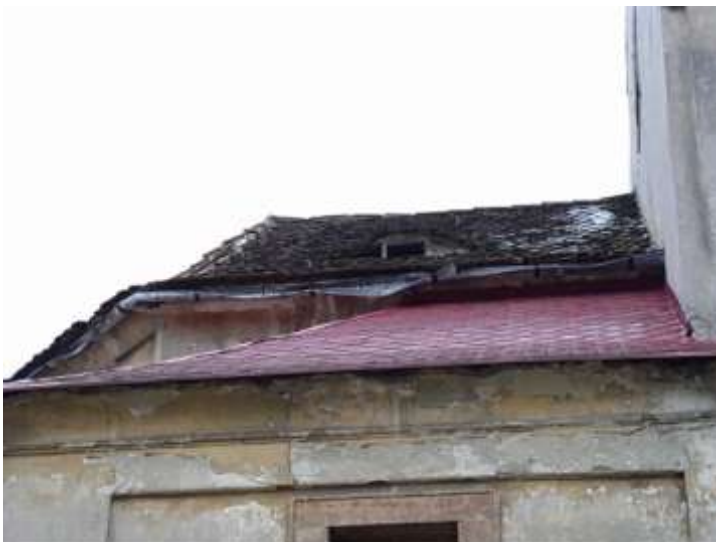
Pavlovice, kostel Nanebevzetí Panny Marie. Pohled na střechu presbytáře od severu dokumentující její havarijní stav.