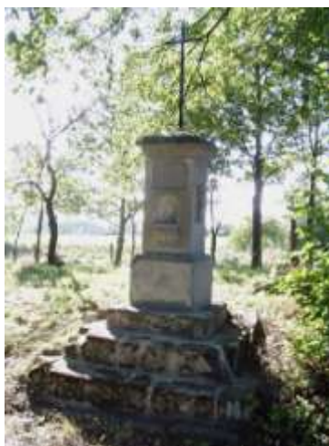
Kříž na severozápadním okraji Častolovic