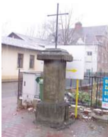
Kříž v Dubici