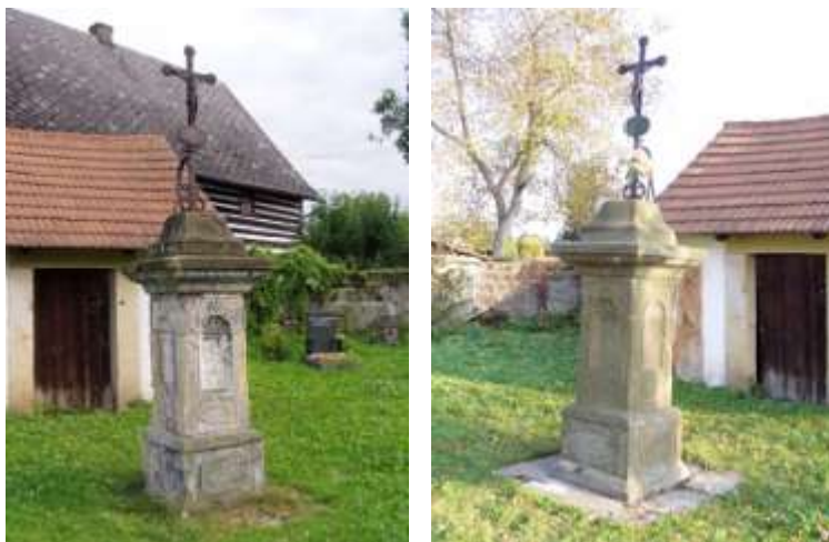
Hřbitovní kříž v Kruhu