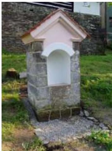
Kaplička v Robčíně