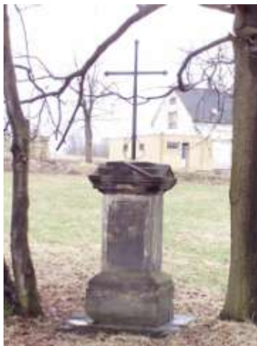
Kříž u hlavní silnice z Kamenického Šenova do Práchně