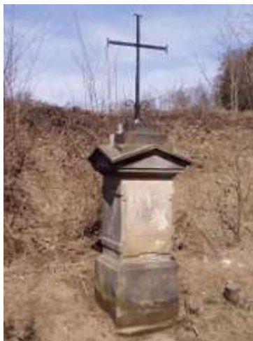
Kříž v Kropbachu u silnice z Juliovky