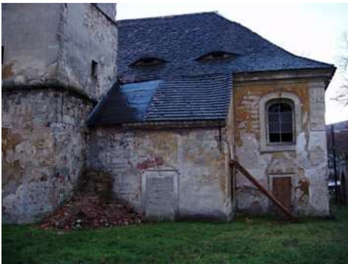
Stvolínky, kostel Všech Svatých. Celkový pohled na severní kapli kostela po provizorním zabezpečení střechy v roce 2005. Celá severní strana střechy kostela ale zůstala i nadále v havarijním stavu.