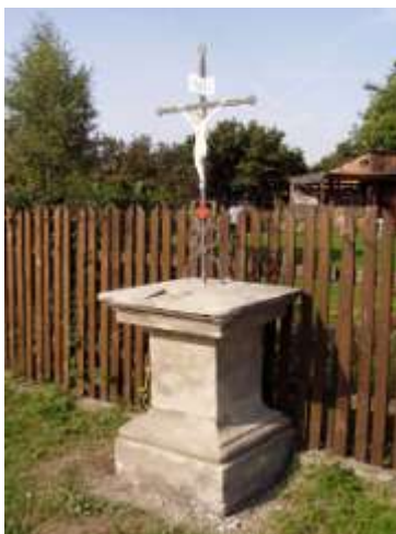
Kříž v Jestřebí u silnice do Provodína