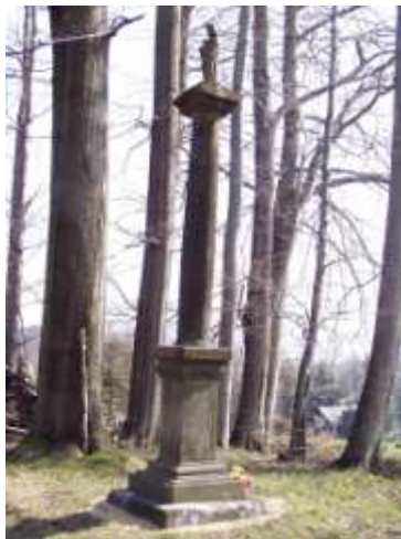
Mariánský sloup v Trávníku