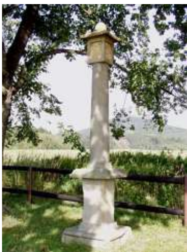
Morový sloup v Kunraticích u Cvikova

Obrázek na titulní stránce: Niesigova kaple v Dubnici