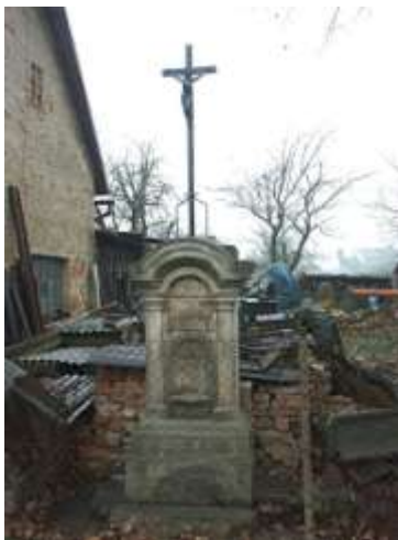
Kříž v Dolní Libchavě v ulici ke hřbitovu