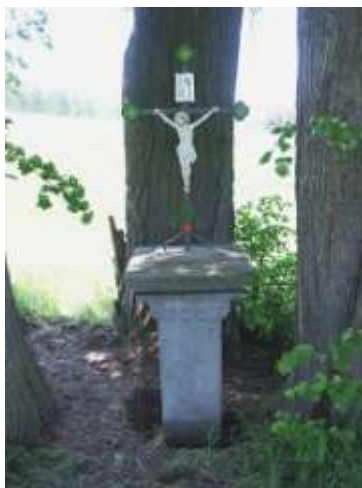
Kříž pod Jelením vrchem u Mařeniček