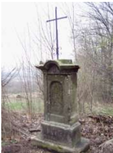
Kříž u silnice z Tanečku do Stvolíneckých Petrovic