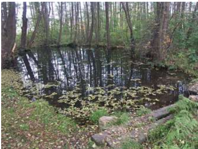
Pramenní tůň Ploučnice

2. Na kraji oné hluboké tůně, která je rodištěm nádherné řeky Ploučnice, je stupeň, na kterém stávají pradelny, když máchají prádlo. Vedle tohoto stupně trčí z vody dva pahýly, na nichž je připevněn třetí, přes který se vymáchané prádlo přehazuje. Před léty se přihodilo, že jedna paní, která tu rovněž chtěla prát, spatřila ke svému nemalému strachu vodníka v podobě svého jediného synáčka, jak sedí právě na těchto pahýlech. Strachem se rozechvělo srdce matky při pomýšlení na to, jaké jejímu domnělému dítěti hrozí nebezpečí. Jenom jeho šaty připouštěly jakousi pochybnost. Přízrak byl totiž skoro nahý, měl na sobě jen modré spodky. „Svatá Matko Boží, dítě, co jen tady děláš?!“ vykřikla plná strachu. Avšak sotva ta slova vyřkla, když tu onen přízrak - neboť jen ten to byl - s sebou plesknul zpátky do vody a byl ten tam. Celá se chvějíc, ve spěchu sbalila prádlo a s roztřeseným krokem spěchala k domovu. Tam ke své nemalé radosti našla své dítě zdravé, přitiskla je k milujícímu mateřskému srdci a bděla nad ním od nynějška s dvojnásobnou ostražitostí.