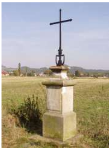
Kříž u cesty z Jestřebí pod Maršovický vrch