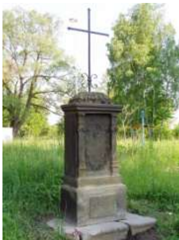
Kříž pod kaplí v Manušicích