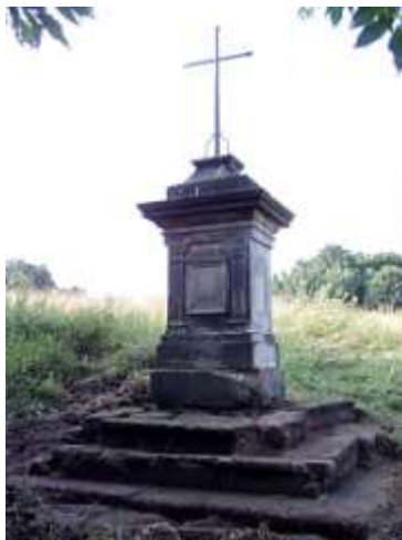
Kříž pod Havraním vrchem u Žandova