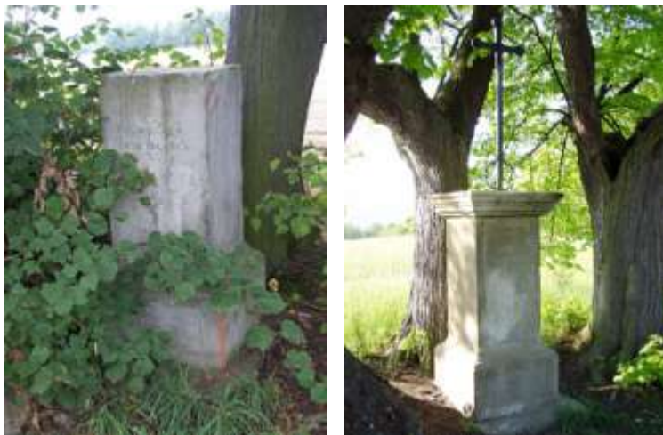
Kříž u silnice z Manušic do Skalice