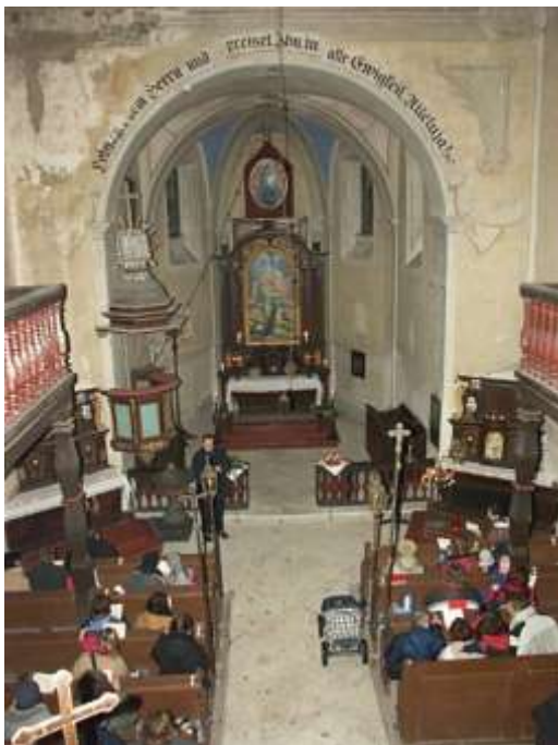
Bohoslužba při setkání u Betlémského světla 23. prosince 2005.