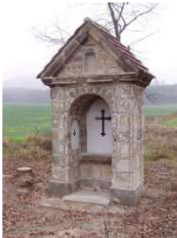
Kaplička pod tratí u Častolovic