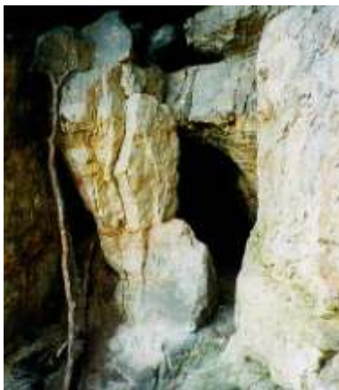
Vchod do poustevníkovy jeskyňky