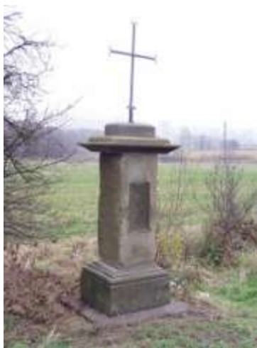
Kříž u silnice z České Lípy do Horní Libchavy