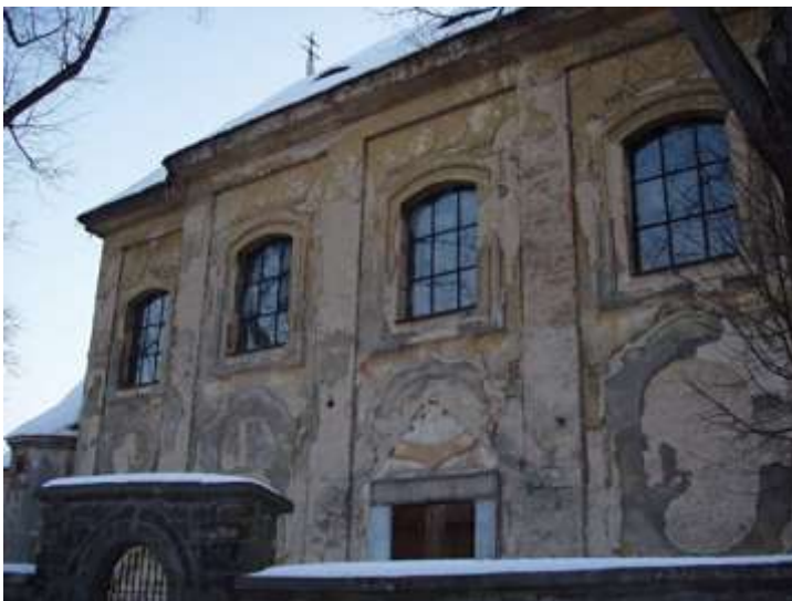
Kvitkov, kostel sv. Jakuba Většího. Celkový pohled od severozápadu na severní fasádu lodi se zbytky omítek.