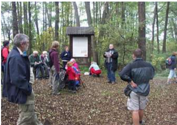
Čtení pověstí u pramene Ploučnice