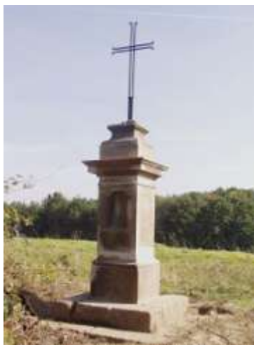
Kříž u cesty z Pavlovic do Drchlavy