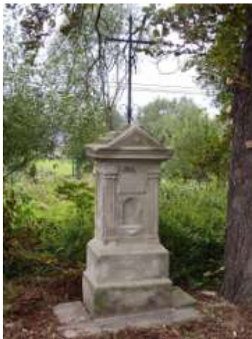
Kříž v horní části Dobranova