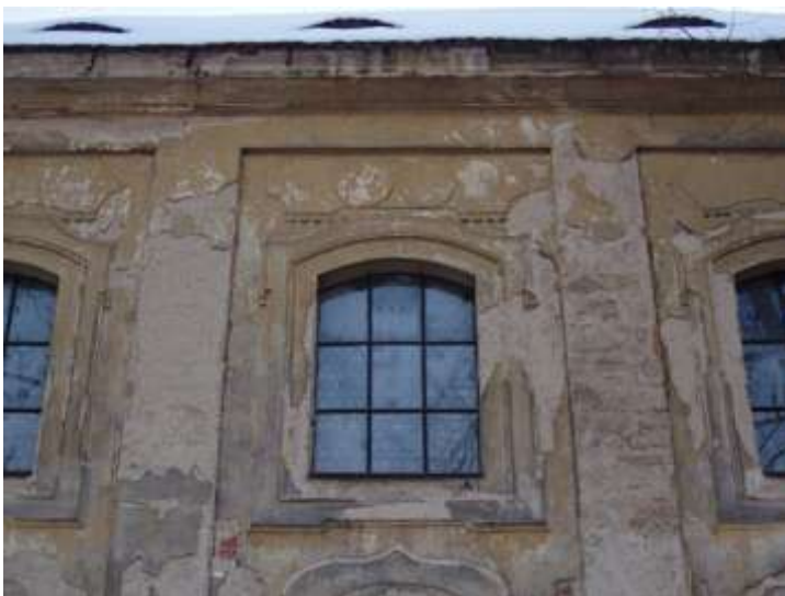
Kvitkov, kostel sv. Jakuba Většího. Detailní pohled od severu na zbytky členění omítek severní fasády lodi kostela.