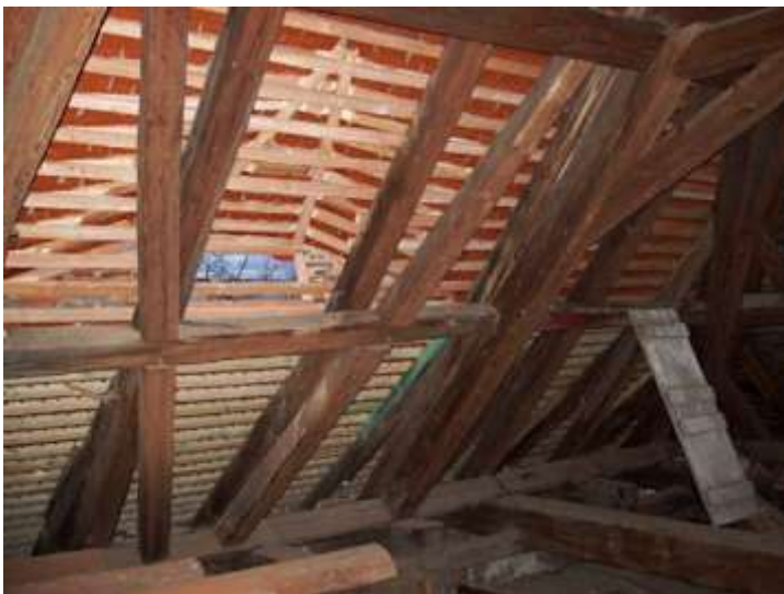
Stvolínky, kostel Všech Svatých. Pohled na obnovené volské oko po opravě v roce 2005.