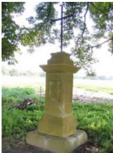
Kříž pod kaštany u Vrchovan