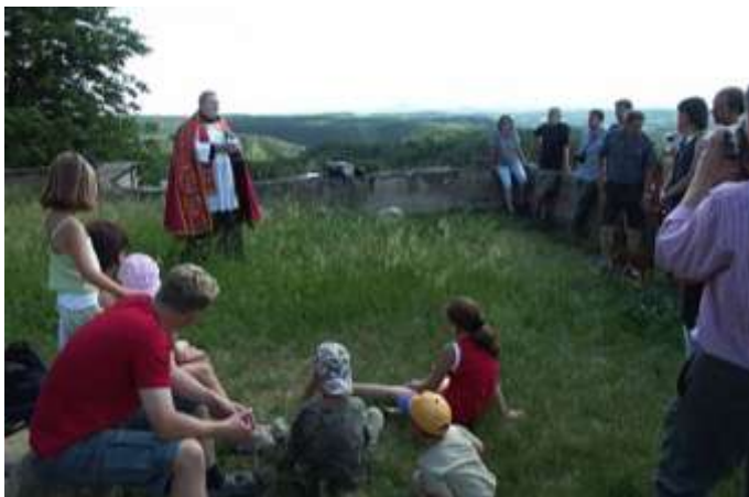
Odpolední pobožnost na Ostrém 19. června 2005.

Dne 19.6.2005 proběhla na Ostrém pobožnost vedená knězem Janem N. Jiříštem z Bělé pod Bezdězem a 10.9.2005 zorganizoval Tomáš Hlaváček velmi úspěšný divadelně-hudební festival.