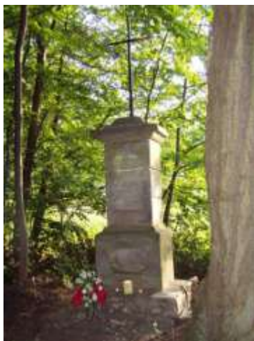
Malchersův kříž u Ždírcce