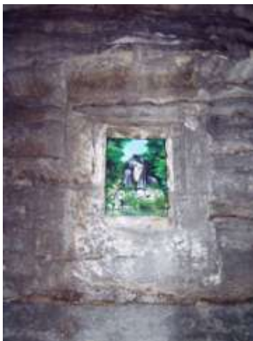
Skalní výklenek u cesty z Okřešic do Srní